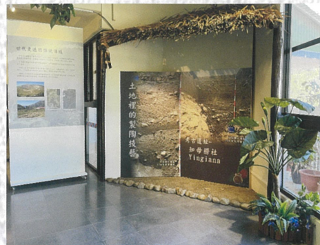
① ② 二樓特展區，每年定期推出2場以上不同主題展覽，展示臺灣原住民族多元文化。