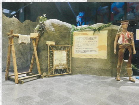
② 常設展區，展示鄒族歷史、祭典文化、文物、生活圖像等。