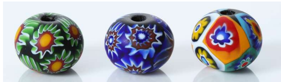
圖3 千花珠，亦是馬賽克珠的一種。(張介字攝)

從民族學文物的角度來看，臺灣南島語族各族群的琉璃珠之顏色圖紋，大致可分為多彩珠、單色珠與金黃珠3種。若再依照形狀區分，又可分為細圓形珠、管狀珠與螺旋珠等珠子。多彩珠乃是珠子外觀紋樣有多種變化，特別是排灣族、魯凱族使用的珠子，不同圖紋的多彩珠有不同的用途與意義。單色珠多作為搭配之用，有些會搭配