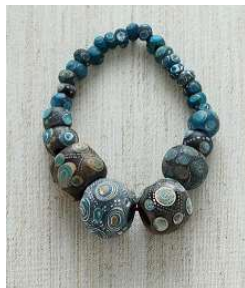
圖1 戰國珠，國立自然科學博物館典藏。

世界各地所使用的琉璃珠種類，依外觀圖紋可分為：(一)眼珠(eye beads)，以圓形圖案為主，用以對抗超自然的力量，是最早發展的珠子，例如戰國珠(圖1)。(二)馬賽克珠(mosaic beads)，是指以各種的圖案鑲嵌組合而成的珠子。(三)雪佛蘭珠(chevron beads)，外觀以英文“V”構成連環圖樣，是義大利威尼斯在15世紀所發展出來的一種珠子(圖2)。(四)千花珠(millefiori beads)，是義大利威尼斯生產的特色珠，以多種圖樣鑲嵌組合而成，是馬賽克珠的一種(圖3)。(五)線珠(striped beads)，珠子外觀是線條構成的圖案，線條組合密疏不同，顏色多樣，普遍存在於各地(圖4)。(六)孔雀珠/羽毛珠(peacock feather beads)，此珠圖紋是在線珠未完全冷卻時以利刃拖