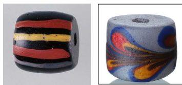
圖4 線珠，國立臺灣史前文化博物館典藏。