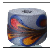
圖5 孔雀珠