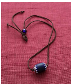
圖2 雪佛蘭珠

拉而成，宛如孔雀翅膀上的花紋，或鳥類羽毛(圖5)。(七)造型珠(molded beads)，珠子多半為單色，獨具特殊造型，例如瓜型珠、頸狀珠、串珠、螺旋珠，甚至是仿製動物或植物等(圖6)。(八)單色珠(monochrome beads)，這類珠子以流傳在印度洋和太平洋地區為主，又稱印度太平洋珠(圖7)。