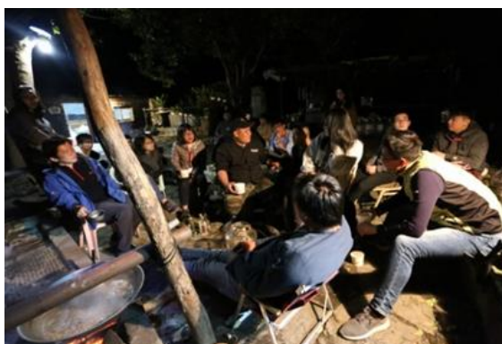
↑部落青年分享故事、古謠教唱