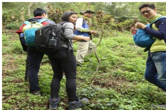
↑耆老介紹民族植物知識