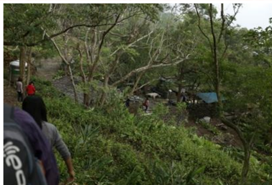
↑舊白鷺部落遺址踏訪