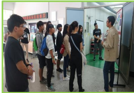
圖 3、推廣活動實況照片