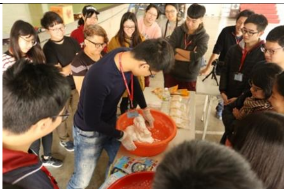
↑ 製作排灣族傳統食物 qavai