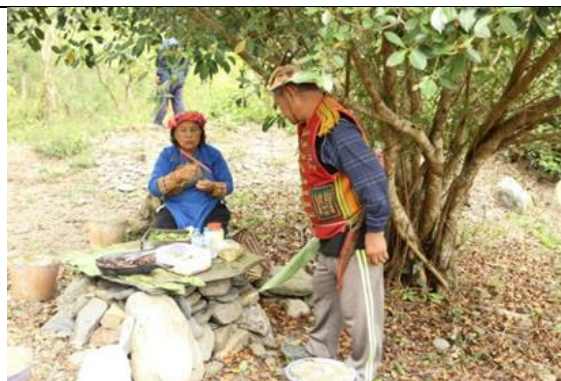
↑ 進入舊白鷺部落前，部落靈媒祈福