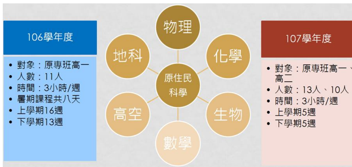
圖 1、成功大學原住民科教小組與來義高中合作專題課程概況

於學期間週三下午實行專題課程，包含物理、化學、地球科學、生物、數學等領域，並由本計畫共同主持人協助進行教學評量。