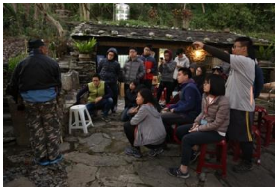
↑ 排灣族獵人介紹狩獵文化與知識