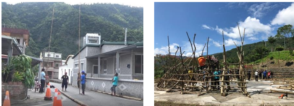
圖 2、部落製作祭桿與祭場情景

自製作，現今為求族人方便，故集中製桿師傅一起製作。祭桿與祭場有相對關係，祭桿的長度影響祭場的大小，祭場大小又以桿數決定，桿數多寡則由頭目決定；也從現任鄉長口中得知傳統上無測量工具時，族人是以畫圓方式搭建祭場，於泥地中心點打個木樁，並在中心點舉桿，以求祭桿長度。