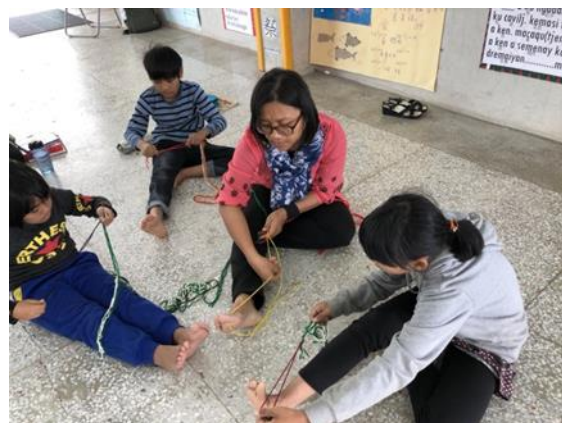
圖 1、民族課程課堂情景