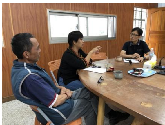
圖 3、與耆老及教師之訪談情景