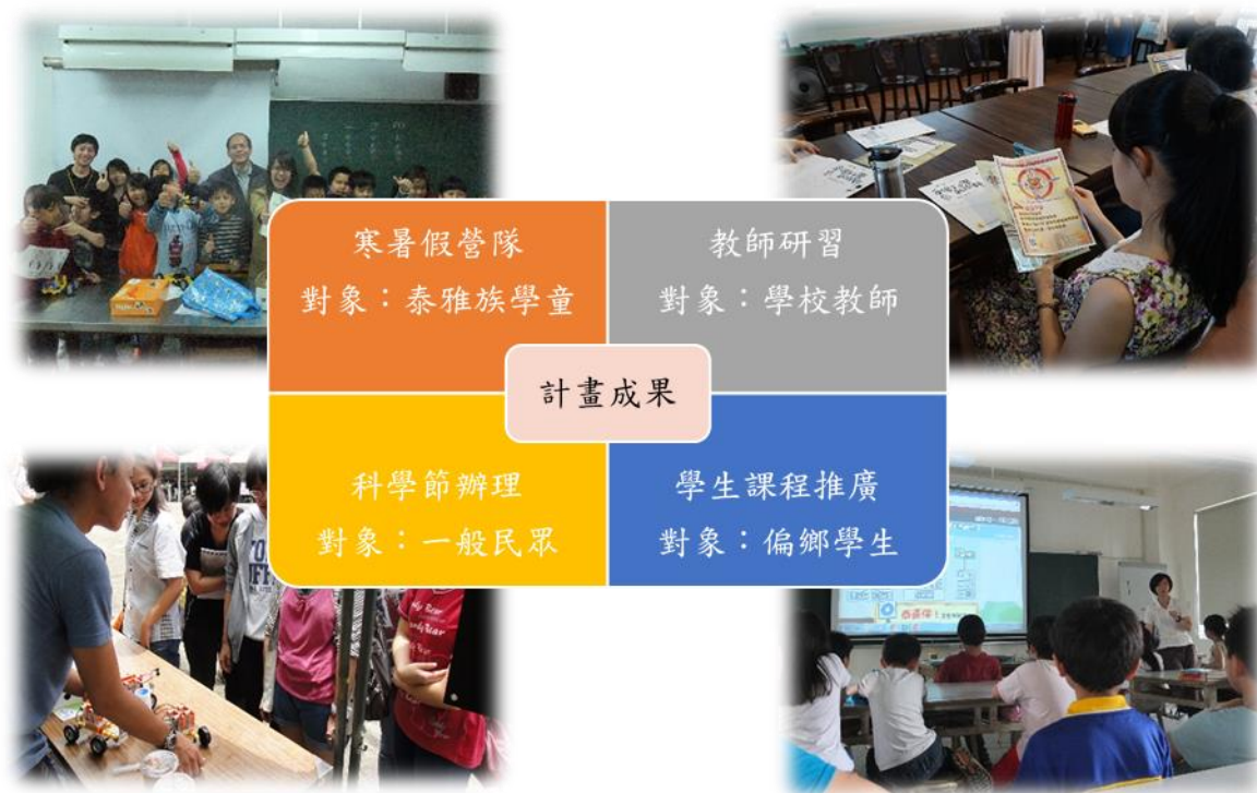
圖 4、推廣計畫構想的示意圖