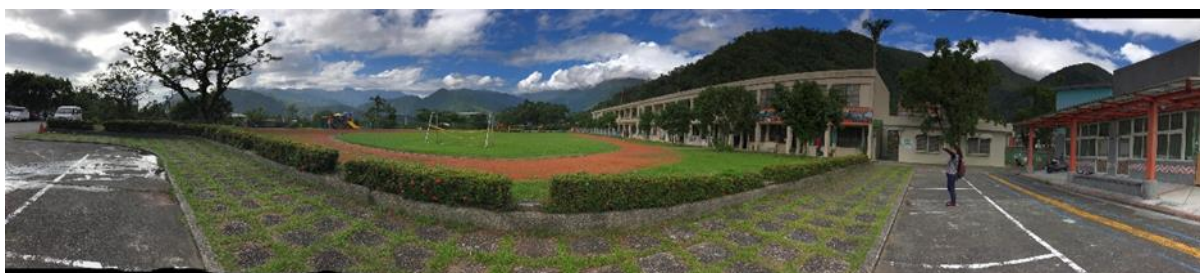
圖 2、南澳國小校園環景圖

在第三期中，計畫團隊持續在宜蘭縣南澳鄉南澳國小實施實驗教育。南澳鄉與西北側相鄰的大同鄉是宜蘭縣境內僅有的兩個山地原住民鄉，境內居民主要是台灣原住民泰雅族，具有獨特的文化特色。參與本研究的南澳國小原住民學童，大多皆為泰雅族人，根據前兩期的經驗，持續將泰雅族文化元素特色融入課程、教材與評量，並使第三期的教學內容發展臻至完善。透過教學實施，除希望有效提升學生的學習成效外，更期待增強其對於自身文化的認同。此外，由於前兩期的耕耘，計畫團隊與當地部落居民、學校行政人員與教師以及學生，都有相當程度的熟悉與信任感，在實施計畫時，部落與學校的參與意願及配合度都很高，使計畫進行更加順利，故第三期的實驗教學，依舊選擇南澳國小持續進行。