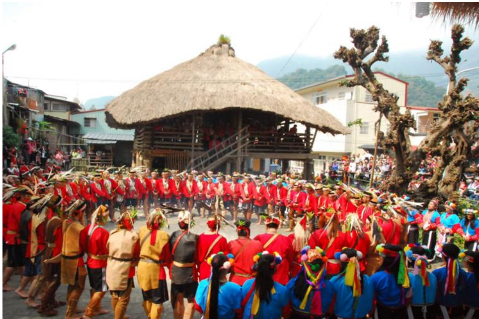
圖二、鄒族達邦部落 mayasvi 儀式(資料：汪明輝 2016)

註：前為會所 kuba ，旁為儀式中砍過樹枝的神樹-雀榕樹做為神梯，祭場中央為火塘。隊伍之家族、性別各有其定位，反映社會結構，部落領袖在前頭引領各氏族長老、青年，後段為女性團體。