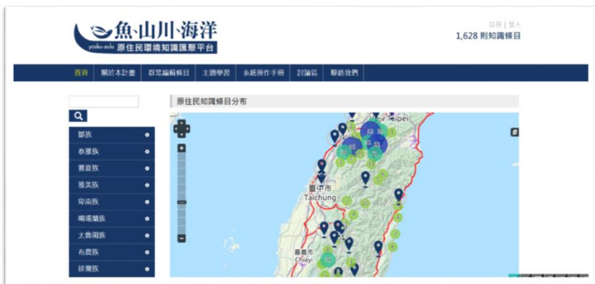
圖一、魚、山川、海洋 - 原住民環境知識匯聚平台首頁

「魚、山川、海洋 - 原住民環境知識匯聚平台」於 103 年 7 月正式上線提供服務以來（網址： http://yosku-aulu.geo.ntnu.edu.tw ），截至 106 年 06 月 30 日止，已累積 1628 條原住民族環境知識條目，227 位有效註冊使用者，平台首頁如圖一所示。