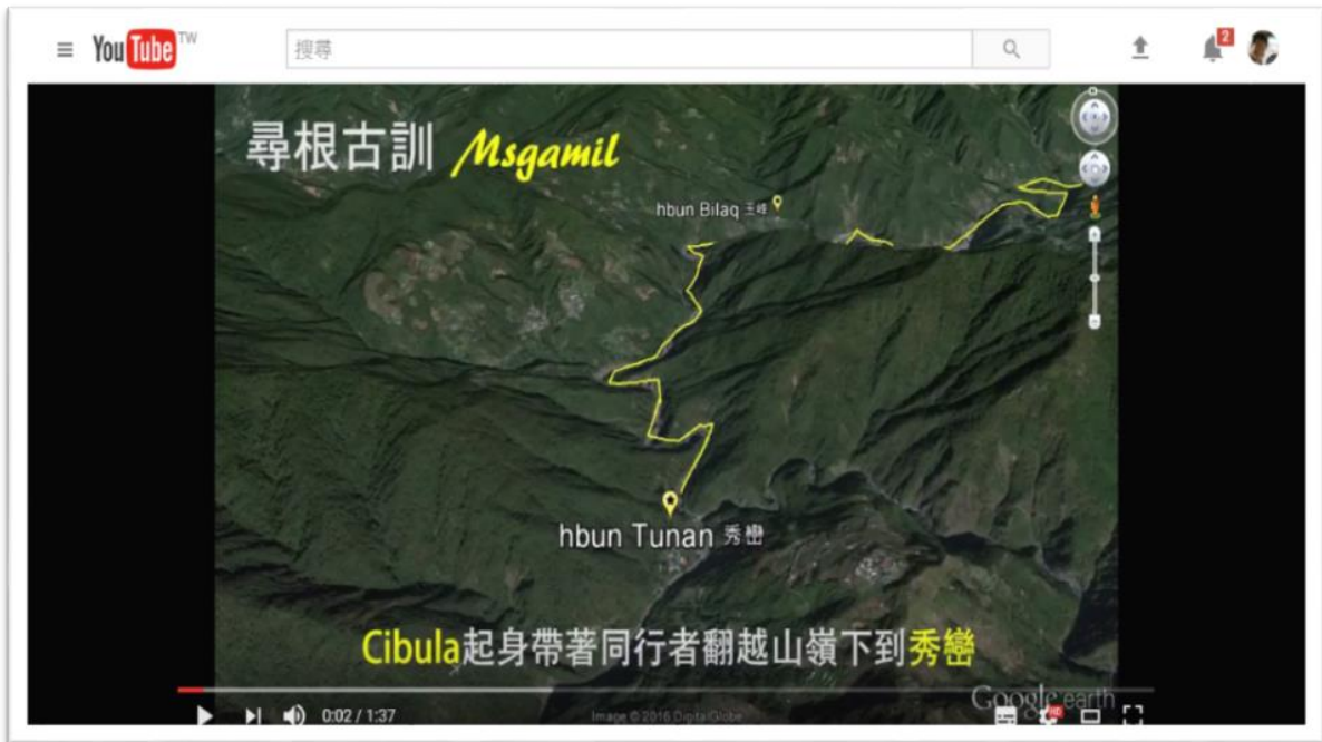
圖五、泰雅族〈尋根古訓〉影片

本子計畫團隊刻正與其他子計畫密切合作，擬將各子計畫成果製作為主題學習單元，並挑選適合部分製作為教學影片。同時，本團隊亦積極推廣平台，希望能吸引更多族人共同編輯知識條目，以達到知識百科之滾雪球效應。懇請原住民族各族族人共襄盛舉，一同為保存族人環境知識而努力。