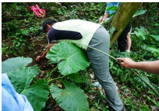
5.講師示範放置在地上的捕鳥陷阱 h'oepona