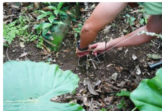
6.講師示範放置在地上的捕鳥陷阱 h'oepona