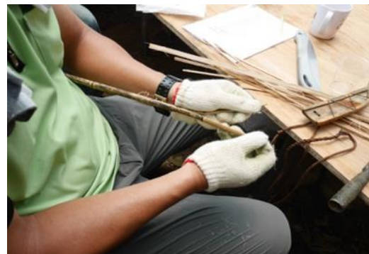
4.講師於現場採集植物製作捕鳥陷阱