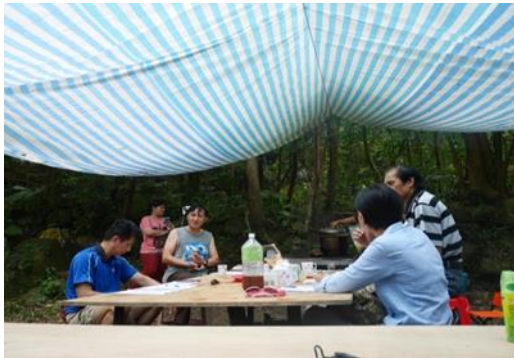
1.「鄒族森林學園教材設計工作坊」於自然空間中舉行