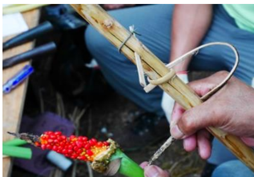
7.講師製作以姑婆芋果子為餌的捕鳥陷阱 pa'suthuca