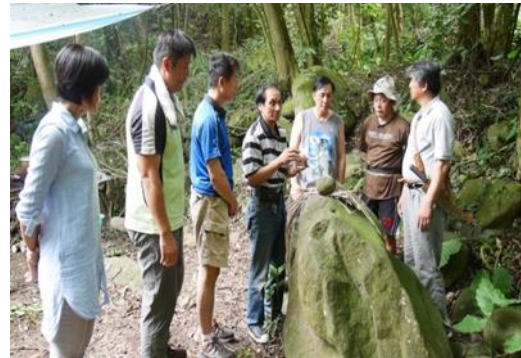
2.耆老為工作坊舉行祈福儀式