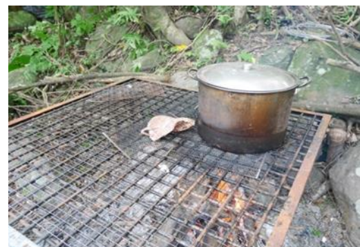
8.講師示範火的使用與野炊方法