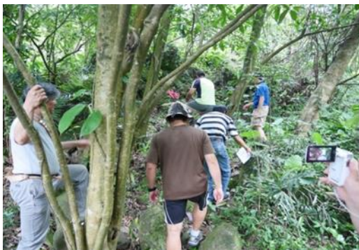
3.講師在山林間尋找適合教學的地點