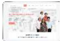
圖 6 平板裝置介面