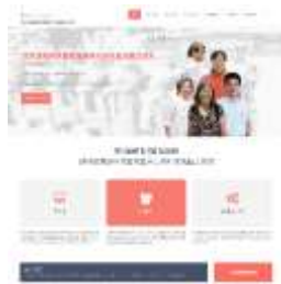
圖 3 首頁的網頁簡介

本網站已經申請專屬之 DNS 網址以利使用者瀏覽，網址為 http://cs.nptu.edu.tw/paiwan ，圖 3 與圖 4 為網站首頁之部分畫面擷取。圖 5、6、7 為使用不同載具進行瀏覽之測試畫面。