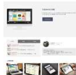
圖 4 首頁計畫發展與成員介紹