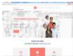
圖 5 桌上型電腦介面