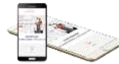
圖 7 手機裝置介面