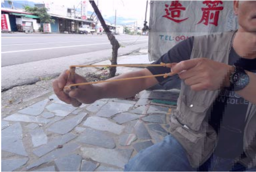
這張是耆老在拉橡皮測試彈弓有沒有綁緊，不然會有橡皮飛掉的危險。