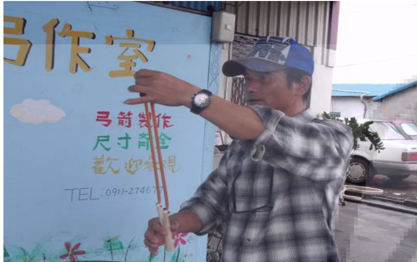
黃叔叔在測試彈弓的兩側有沒有平衡、躬身有沒有正 Y 形。