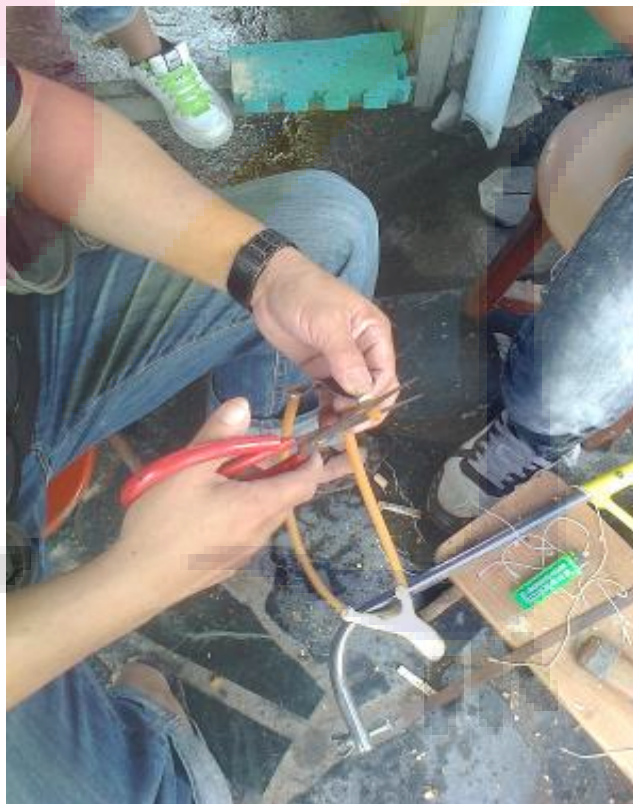
把多餘的橡皮用剪刀剪掉，好讓兩邊的橡皮能夠一致且對稱。