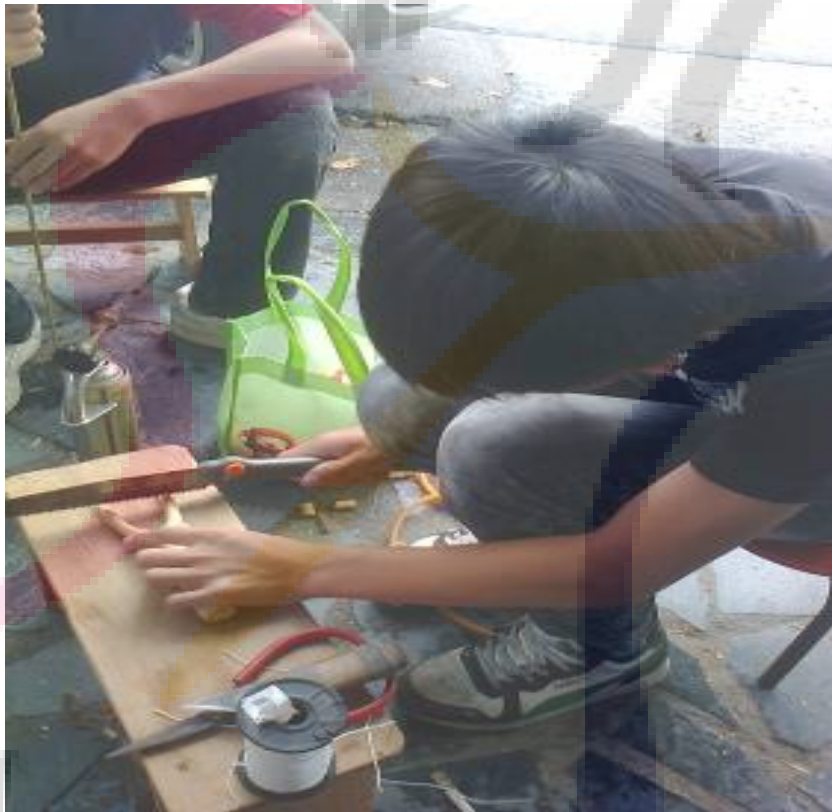
我的技術太差了，弓槽鉅不好，橡皮也綁不緊，一直重做，可見得訓練不夠