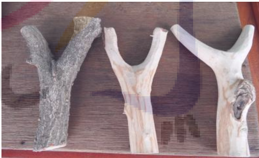
這張照片是，三種同樣木頭（桂花木）的弓身，但是樣式都不同。

手術用乳膠管彈弓橡皮（醫療用俗稱 止血帶/引流管的管膠，拉力強），可在藥局購買。乳膠管讓彈弓橡皮因彈性疲乏或不慎拉斷時，能適時補充。手術用乳膠管也常來搭配金屬棒彈弓，只要使用少量酒精就能夠快速地將橡皮裝在彈弓上，完全不需要使用任何工具：繩線或黏膠。以上兩種橡皮都是相同的管狀，因此能夠使用在射擊比賽中。