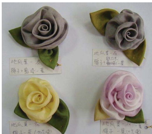
圖八：都是用蕃薯葉染成的不同顏色的蠶絲布花

多種因素，而染成不同色調。南投中寮媽媽們染製的四朵玫瑰胸花都是用地瓜葉染絲布，卻出現不同的顏色（見圖八）。同樣用洋蔥皮染的兩條絲巾，卻出現不同的色調（見圖九）。這是因為染媒劑在布料纖維與色素之間扮演「聯繫者」的角色。染媒劑會與纖維產生鍵結，同時也與染料的色素產生鍵結，於是將纖維與色素兩者緊緊地結合，達到染色的效果。通常植物染的布料以天然纖維的染色效果最好，像棉、麻、蠶絲等，尤其是蠶絲的效果最好，棉的效果最差。因為植物製染料