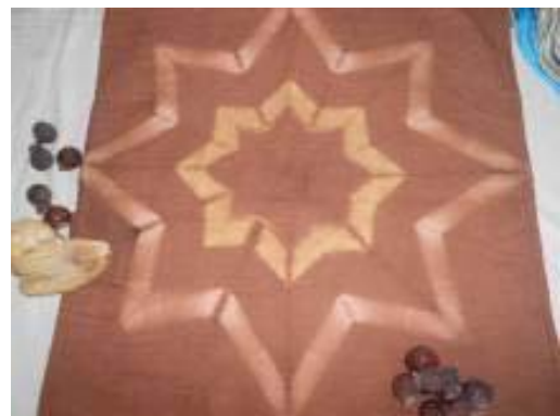
圖七：用熟曬的薑黃、檳榔萃取植物色素染出獨特的顏色