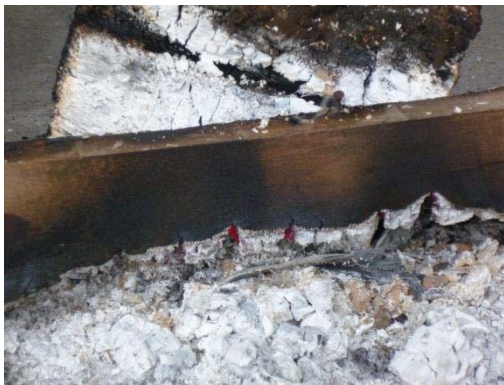
圖三：燒製降溫後的草木灰

祭典完成後，點燃芒茅草與木頭。燒灰過程，茅草、五節芒、龍眼小樹枝為底部，再放置木頭。燒製時間大約二十四小時或一天一夜，須全程在場守護，以便隨時控制火勢以及維持火候，保持燃燒木灰的均衡度。等待茅草、五節芒、樹枝、木頭都燒成灰(見圖三)。等降溫後，再一次祭祀感謝祖靈保佑，才可取草木灰。將草木灰與山泉水混合後過濾(見圖四)，倒回去再過濾一次，重複至少三天每天至少三遍(見圖五)。將最後過濾的草木灰水與染好的棉麻布浸泡之後覆蓋於土壤內隔絕氧氣，使染布成形。最後用無患子植物做皂洗過程，將染成的布洗過(見圖六)，陰乾後即可，所染出的顏色非常獨特(見圖七)。