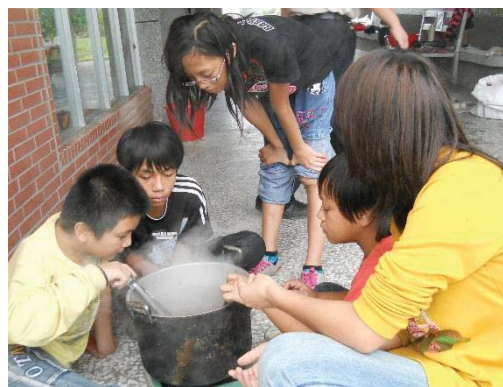
圖二：將綁好圖樣的棉麻布放在染料進行染煮（楊惠嫻提供）

為了傳承阿美族草木灰與植物染文化，帶著孩子跟著耆老上山砍柴。木柴完全陰乾後，經過祖靈託夢而選定地點，選擇乾燥晴天的日子染布（見圖一）。染布地點在溪岸或空曠地，先煮染材，利用不同溫度的水，將天然植物色素充分溶解，行程濃縮液，做成染液（見圖二）。將棉麻布綁成所要的圖樣。基本的準備工作完成，燒柴點火前，所有參與人員先一起祭祀祖靈，驅趕邪惡靈（阿美族語 mifetik），以保佑染布成功。但是前晚有做惡夢者、放屁、打嗝、打噴嚏者，不得參加。