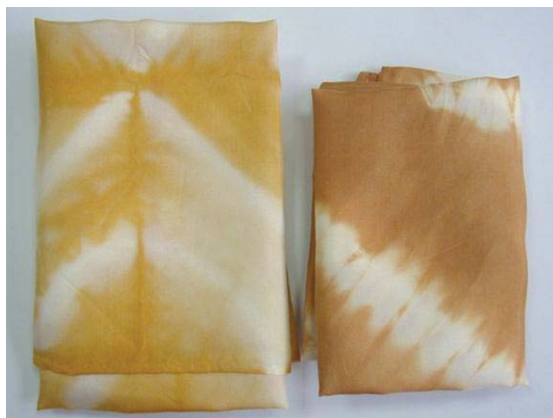
圖九：同樣用洋蔥皮染成的不同色調蠶絲巾

可和動物蛋白質分子如蠶絲，彼此產生吸引力而讓色素與纖維緊密結合。植物染的布料在使用一段時間後，色澤會更自然，尤其是一、兩年後，色澤最美（陳碧棠，2001）。