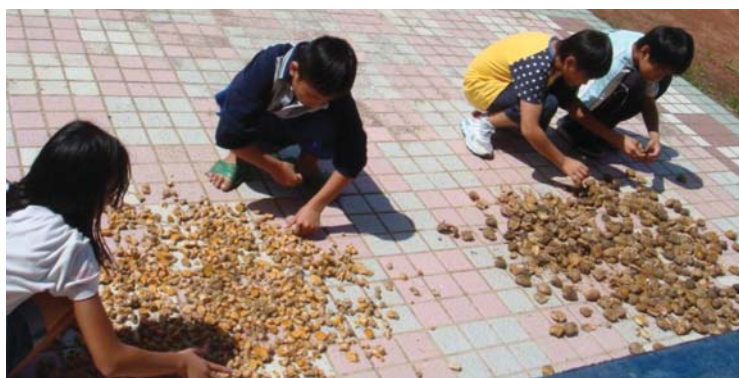
圖一：選擇乾燥晴天的日子染布，小朋友正在曬檳榔和薑黃染材

豐年祭期間走訪花蓮河東部落，連續好幾天都在秀姑巒溪河床，想親近瞭解河東部落特有的部落文化。看到雀、白鷺鷥、芒草、水芹菜、銀合歡樹、沙堆及大小石頭。此部落離秀姑巒溪河岸邊有幾百公尺，那外